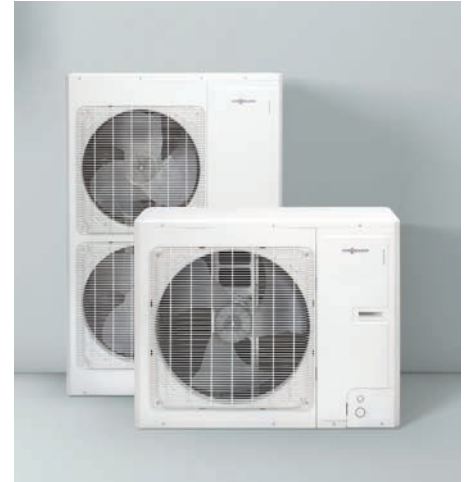
Vitocal 100-S dış üniteleri

Modernizasyon işleri için split ısı pompası özellikle çok uygun, çünkü mevcut ısı üreticisi ile kombine edilerek bivalent işletme türü mümkün olabilmektedir. Mevcut ısı üreticisi sadece pik ihtiyaçlarda devreye girer.